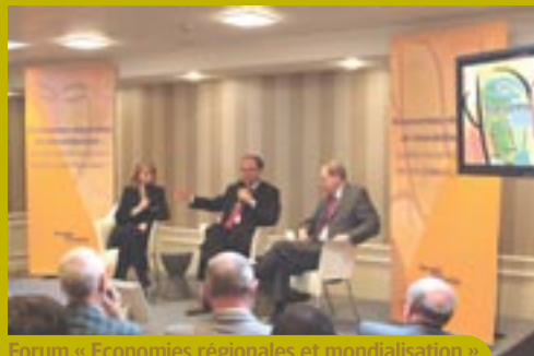
Forum « Economies régionales et mondialisation ».

« Notre volonté est d'ouvrir l'horizon des représentants des sociétaires au-delà du réseau des Caisses d'Epargne, de nourrir des problématiques actuelles. Ce qui fait la force de nos entreprises : la proximité. »