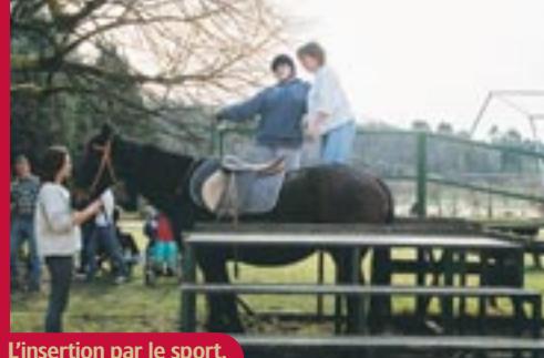
L'insertion par le sport.

Ces dizaines de millions d'euros, distribués chaque année par les Caisses d'Épargne, sont déterminants dans la réalisation des projets. Il ne s'agit pas de mécénat, encore moins de sponsoring. Les montants investis proviennent des bénéfices dégagés dans les régions par les activités bancaires des Caisses d'Épargne. Et ils reviennent à l'économie du territoire.