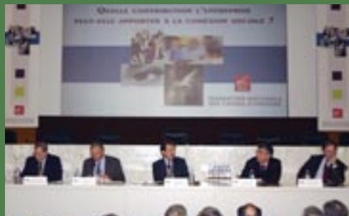
Colloque sur la contribution de l'entreprise à la cohésion sociale.

« Dans nos sociétés développées qui sont de plus en plus fondées sur les connaissances, la circulation de l'information et les réseaux d'acteurs, l'engagement en faveur de la cohésion sociale peut constituer un atout concurrentiel, notamment en termes d'image. »