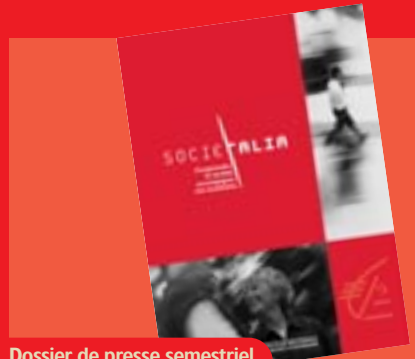
Dossier de presse semestriel, l'un des outils de Sociétalia.

« Pour faciliter la mise en place d'un sociétariat vivant et animé, la Fédération Nationale des Caisses d'Epargne s'est dotée d'outils de connaissance des sociétaires regroupés au sein de Sociétalia, outil de veille sociétale. »