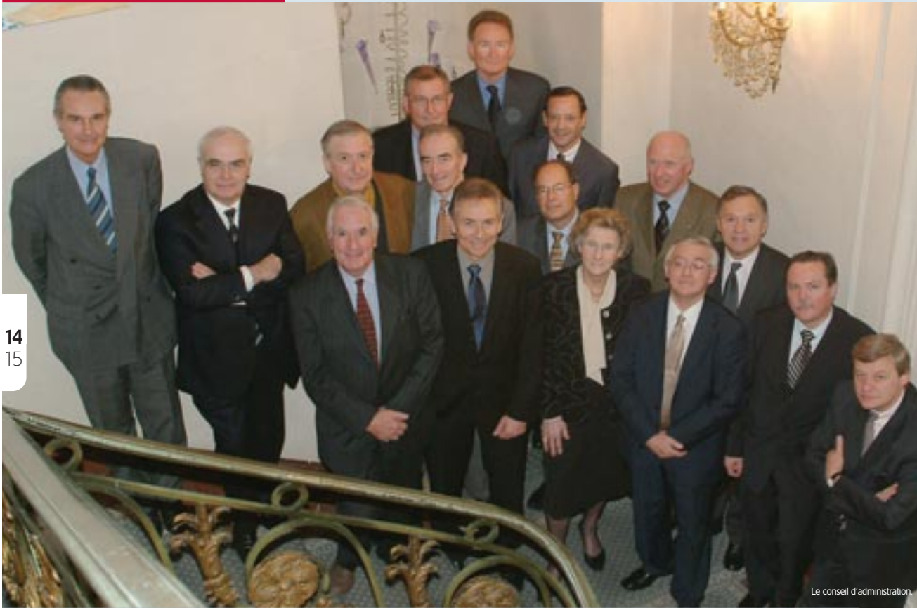
Le conseil d'administration